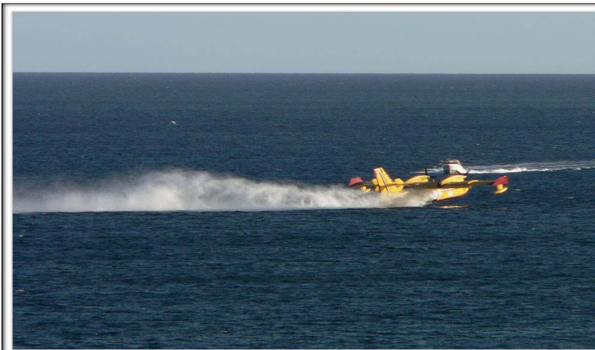
Formia - Campagna AIB 2009

Comuni di : CASTELFORTE - FORMIA - GAETA - ITRI - MINTURNO - SANTI COSMA E DAMIANO - SPIGNO SATURNIA (LT)